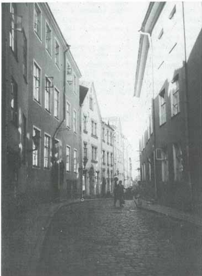
En lugn gata i Tallinn

Förra året arrangerades också en internationell körfestival (Tallinn 88) från vilken vi rapporterade i Körledaren i ett tidigare nummer. Den typen av festival kommer också att återkomma regelbundet.